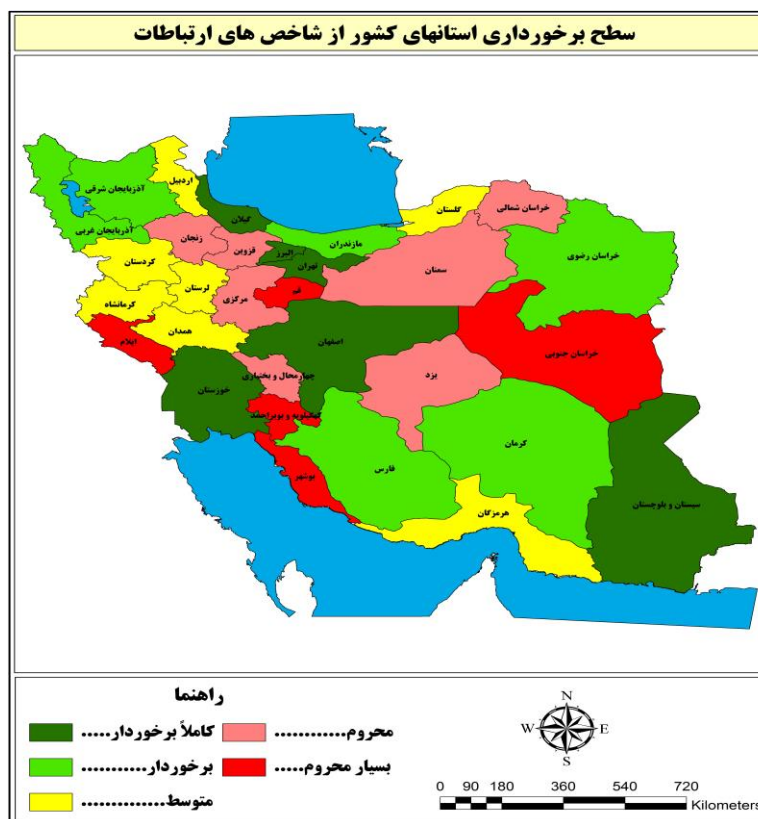
شکل 2. سطح برخورداری استانهای کشور از شاخص های ارتباطات