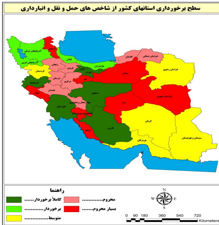
شکل 1. سطح برخورداری استانهای کشور از شاخص های حمل و نقل و انبارداری