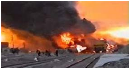
شکل ۱. تصویری از رویداد سانحه ایستگاه خیام

حادثه یعنی نفتا، آمونیاک و پنبه، گوگرد را نشان می‌دهد. این تصویر که ساعتی قبل از وقوع انفجار اصلی را نمایش می‌دهد؛ حجم بالای آتش و حرارت و حضور نیروهای امدادی و اهالی منطقه در نزدیکی محل وقوع حادثه بدون آگاهی از خطرات محتمل ناشی از اطفای مواد خطرناک با آب قابل مشاهده است.