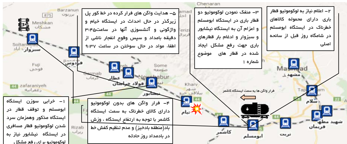
شکل ۳. نمایی از توالی رویدادها در زمان حادثه

۱۱:۱۶، تعداد ۳۸ واگن محتوی نفتا، نیترات آمونیوم، گوگرد و پنبه از ایستگاه سرخس بارگیری و به سمت تهران حرکت می‌کند و در ایستگاه ابومسلم به لحاظ نیاز به دیزل این قطار و واگن‌ها در خط چهار این ایستگاه و در جلوی ۱۳ واگن مذکور قرارداد شده و پس از اتصال به واگن‌ها متوقف می‌شوند. ترمزبان ایستگاه ابومسلم، مدعی است جهت تثبیت واگن‌ها اقدام به بستن ترمزهای دستی واگن‌ها کرده و کفش خط‌های لازم را نیز در محل خود نصب کرده است.