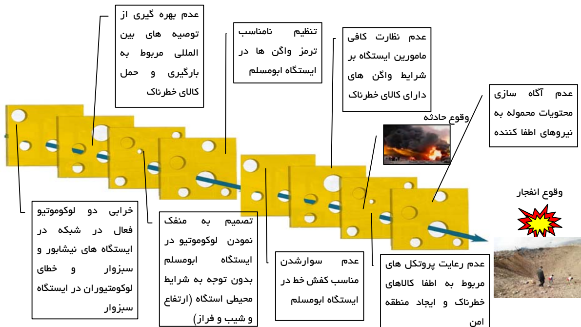
شکل ۶. الگوی پنیر سوئیسی رویداد سانحه خیام

لوکوموتیو از قطارهای باری در ایستگاه‌های غیرتشکیلاتی ممنوع گردید. به‌هرحال سانحه هیچ‌وقت خبر نمی‌کند و تجربه نشان داده که تنها راه منطقی و سریع مقابله با سوانح ناشی از مواد خطرناک، مستلزم برخورداری از تجهیزات، اطلاعات کافی در مورد کالای خطرناک، تیم‌های ویژه، ابزارهای مختلف کار و ... است. باید به این نکته توجه نمود که مخارج لازم جهت تربیت نیروهای ویژه، خرید تجهیزات و تشکیل سیستم‌های اطلاع‌رسانی اضطراری برای مقابله با خطر بسیار کمتر از خساراتی است که سانحه کالای خطرناک به انسان، محیط‌زیست و اموال وارد می‌کند.