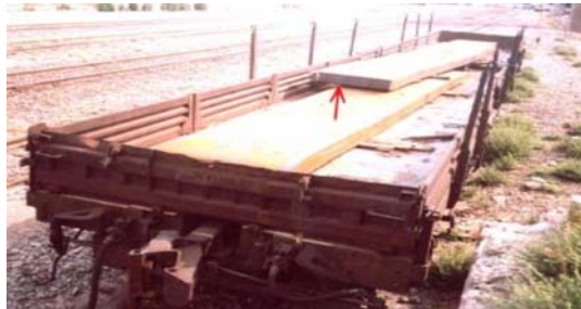
شکل ۵. یک طرفه بودن بار بر خلاف دستورالعمل حمل کالای خطرناک

۷-۴- یکنواختی بار و جلوگیری از یک طرفه شدن بار یکی دیگر از علل اصلی بروز سوانح عدم توزیع یکنواخت بار در واگن‌ها است (شکل شماره ۵). به این صورت که بار واگن‌ها هنگام بارگیری در واگن به صورت همگن توزیع نشده و