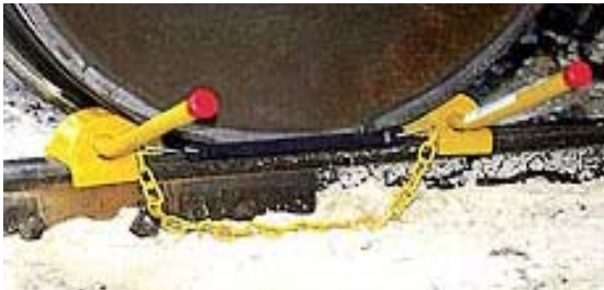
شکل ۴. کفش خط مدرن (اسولد، ۲۰۰۱)