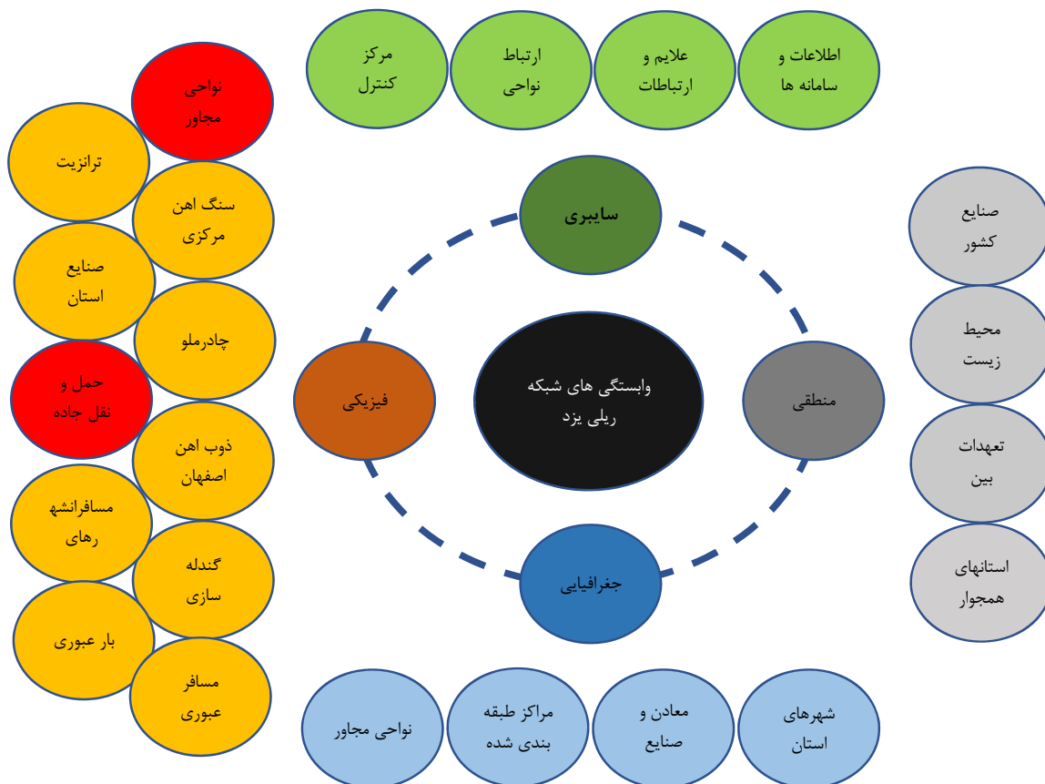
شکل ۱. مهم‌ترین وابستگی‌های شبکه ریلی استان یزد (نگارنده)

در نهایت بررسی وابستگی‌های شبکه ریلی در انواع مختلف آن شکل شماره ۱ را به دست خواهد داد.