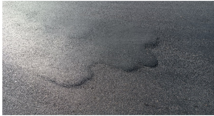
شکل ۹. خرابی تورم روستای گلما سفلی ساری