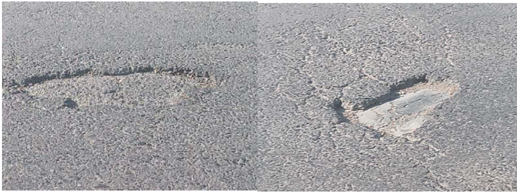
شکل ۱۱. خرابی چاله روستای معلم کلا ساری