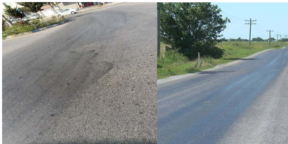
شکل ۱۵. خرابی قیر زدگی محمد آباد فریم