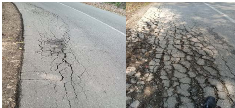
شکل ۷. خرابی ترک خوردگی لبه مسیر جنگلی هزارگریب نکا