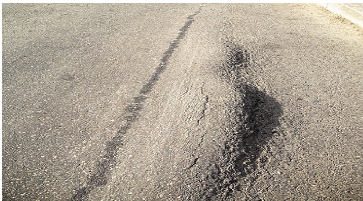
شکل ۱۳. خرابی کنار رفتگی مسیر گهرباران میاندرود

کناررفتگی عبارت است از جابجایی طولی دائمی یک ناحیه محدود از سطح روسازی در اثر بارگذاری ترافیکی. هنگامی که ترافیک به سطح روسازی فشار وارد می‌آورد یک موج کوتاه ناگهانی در سطح روسازی ایجاد می‌شود. این خرابی معمولاً تنها در روسازی‌های با مخلوط آسفالتی روان و ناپایدار (قیر محلول یا امولسیون) روی می‌دهد. (معمولاً در آسفالت سرد روی می‌دهد. (ASTM D6433, 2007). کناررفتگی همچنین در محلهایی بوقوع می‌پیوندد که روسازی آسفالتی به