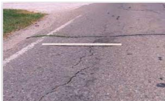
شکل ۱. خرابی برآمدگی و فرو رفتگی در سطوح مختلف