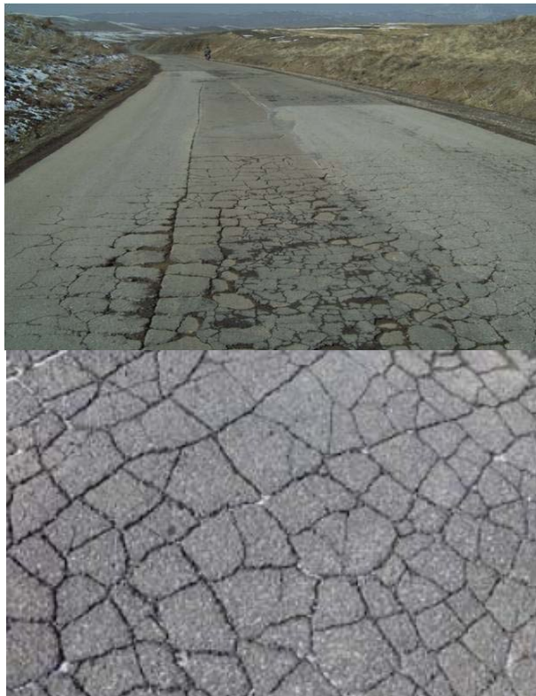
شکل ۳. خرابی ترک خوردگی بلوکی روستای گزناسرا

کوچک چند وجهی با لبه‌های تیز تشکیل می‌دهند. همچنین برخلاف ترک‌های بلوکی، ترک‌های پوست سوسماری در اثر تکرار بارگذاری ترافیکی ایجاد می‌شوند و لذا تنها در نواحی ترافیکی دیده می‌شوند (به طور مثال در مسیر عبور چرخ‌ها). (Lavin, 2003). این نوع خرابی بر حسب متر مربع سطح رویه اندازه‌گیری می‌شود و معمولاً در یک قطعه معین روسازی در یک سطح شدت یکسان بوقوع می‌پیوندد. هریک از نواحی روسازی که دارای سطح شدت متفاوتی باشد می‌بایست به