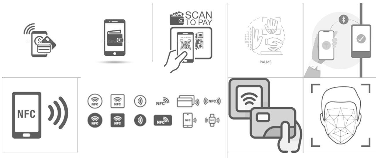
شکل ۲. مروری بر انواع فناوری های پرداخت الکترونیک

خصوصی پاسخ دهد. عکس ها و اثر انگشت ها معمولاً برای شناسه های رسمی و شناسایی در سوابق جنایی استفاده می شوند. علاوه بر این، تشخیص چهره می تواند در دوربین های نظارتی استفاده شود، که موقعیت و اقدامات یک فرد را بدون اینکه متوجه شود شناسایی می کند. با توجه به این واقعیت که اسکن رگ های کف دست یک فرآیند فعال است، که در آن کاربر موافقت می کند که با قرار دادن دست در مقابل سنسور شناسایی شود و ارتباطی با این مسائل ندارد، ممکن است برای افرادی که